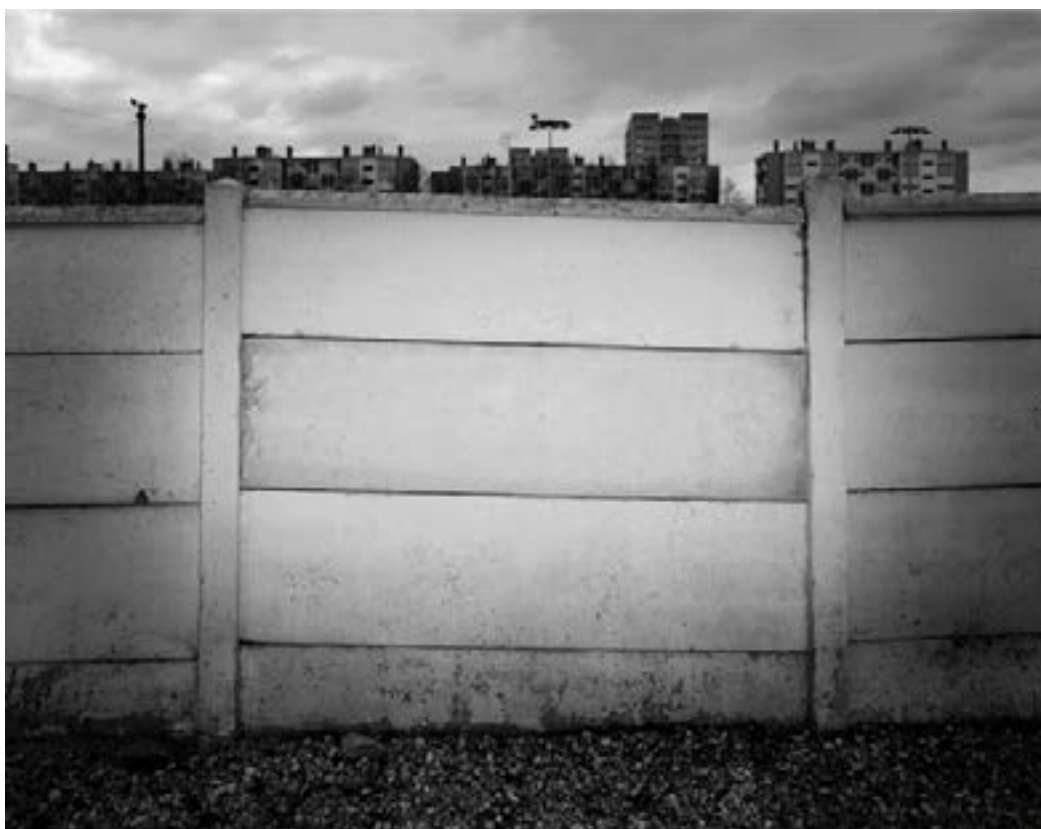
Palissade, Saint-Jean/Villeurbanne

Né en 1977 à Genève, Karim Kamal vit à Lyon. Il se forme à l'École d'art d'Avignon, de Grenoble et à l'École de photographie de Vevey. Parmi une sélection d'expositions nous pouvons citer sa participation à Là ou les eaux se mêlent , 15e biennale de Lyon (2019), Photographier l'Algérie à l'Institut du monde arabe de Tourcoing (2019), la commande nationale Les Regards du Grand Paris (2017), Le Pont au MAC Marseille (2013), J'ai deux amours au musée d'Art moderne d'Alger (2010) et son exposition personnelle L'Arrière-pays au Centre d'Art de Lacoux (2015).