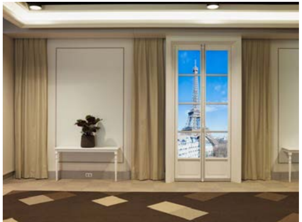
Aeropolis, Paris

Il enseigne la photographie en écoles d'art et à l'Université. son travail est présent dans différentes collections publiques et privées. (Cnap, Frac PACA, BNF Paris, musée d'Art contemporain du Valais en Suisse...)