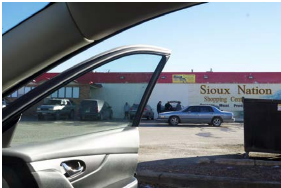
Réserve Pine Ridge South Dakota. «The way back». © White Eagle, 2017

Pour l'exposition collective The Way Back au Bleu du ciel et à la Bibliothèque du 1er arrondissement de Lyon (2017-2018), le photographe est revenu sur les traces de Sitting Bull, de Crazy Horse et de Red Cloud, arpentant les lieux sacrés des indiens Sioux du Middle West. Il est parti à la rencontre du passé glorieux des guerriers des années quatre-vingt du XIXe siècle, se confronter au silence du Nebraska au Colorado en passant par le Montana et le Wyoming, où aucune âme qui vive, jamais ne le salua.