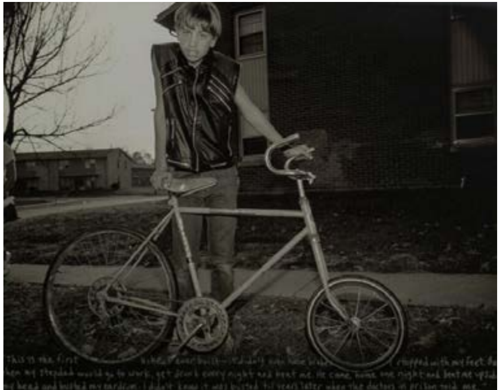
Pigeon Hill - Then and now

Les photographies de Jeffrey A.Wolin (né en 1951) ont été présentées dans plus d'une centaine de lieux en Europe et aux Etats-Unis, notamment lors d'expositions individuelles à l'Art Institute de Chicago, l'ICP de New York, au musée George Eastman de Rochester et au musée de la photographie contemporaine de Chicago ; et d'expositions collectives au MoMA, au Whitney Museum et au LACMA de Los Angeles. Il est l'auteur de plusieurs monographies, notamment Written in Memory : Portraits of the Holocaust (Chronicle Books), Inconvenient Stories : Vietnam War Veterans (Umbrage) et Pigeon Hill : Then & Now (Kehrer)