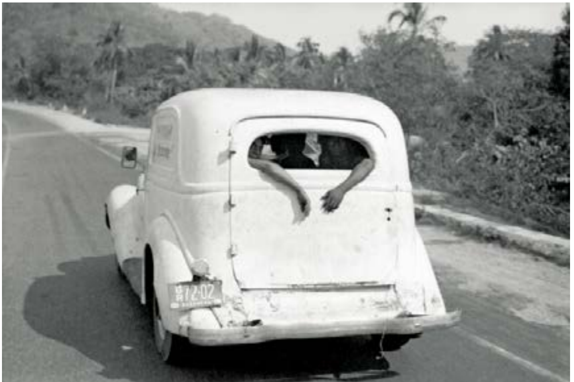
Guerrero Mexique © Bernard Plossu, 1966

Né au Vietnam en 1945, il part vivre au Mexique en 1965, puis à New Mexico de 1977 à 1985. Il réalise une exposition rétrospective au MNAM Centre Pompidou en 1988 et obtient le Grand Prix national de la photographie. Il vit et travaille dans le sud de la France.