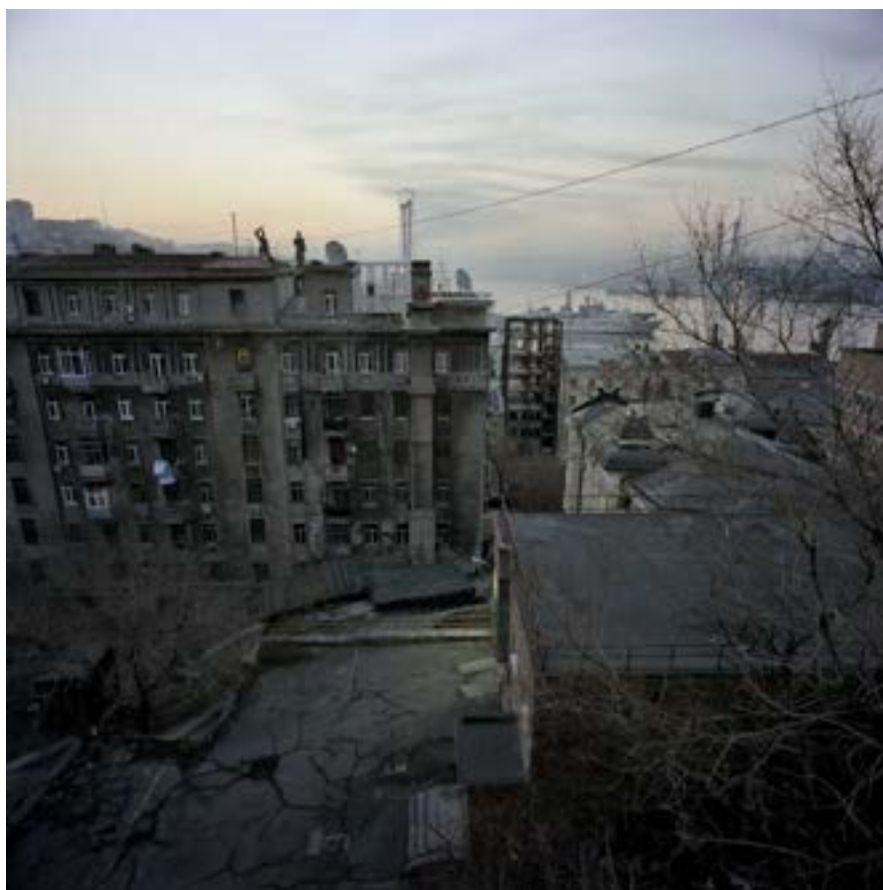
Vladivostok - Hôtel «Le marin»

Alexandre Christiaens est né à Bruxelles en 1962. Il vit et travaille à Dave, près de Namur. Actuellement, son travail reste appliqué principalement à la photographie argentique noir et blanc. En Belgique et à l'étranger, il a dirigé des ateliers photographiques et participé à des expositions individuelles et collectives. Depuis 1999, ses photographies sont reprises dans plusieurs collections publiques et privées. Il a publié plusieurs ouvrages, notamment Hunter Grill (2017), Estonia (2016), Eaux vives, peaux mortes (2012), En Mer, voyages photographiques (2008).