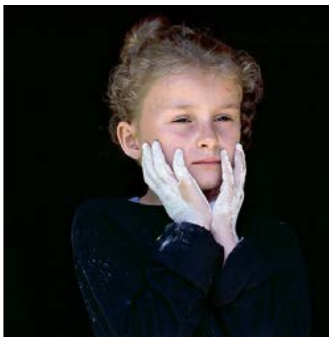
Sans titre #67 de la série «La vie courante»

Elle s'intéresse particulièrement à la représentation de la figure humaine au sein d'espaces de vie collective : espace public, urbain, hôpital, logement social, école, famille.