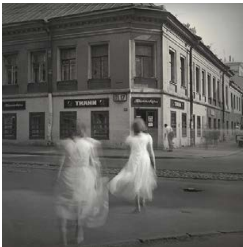
Les femmes en robes blanches Série : ville des ombres, Saint-Pétersbourg