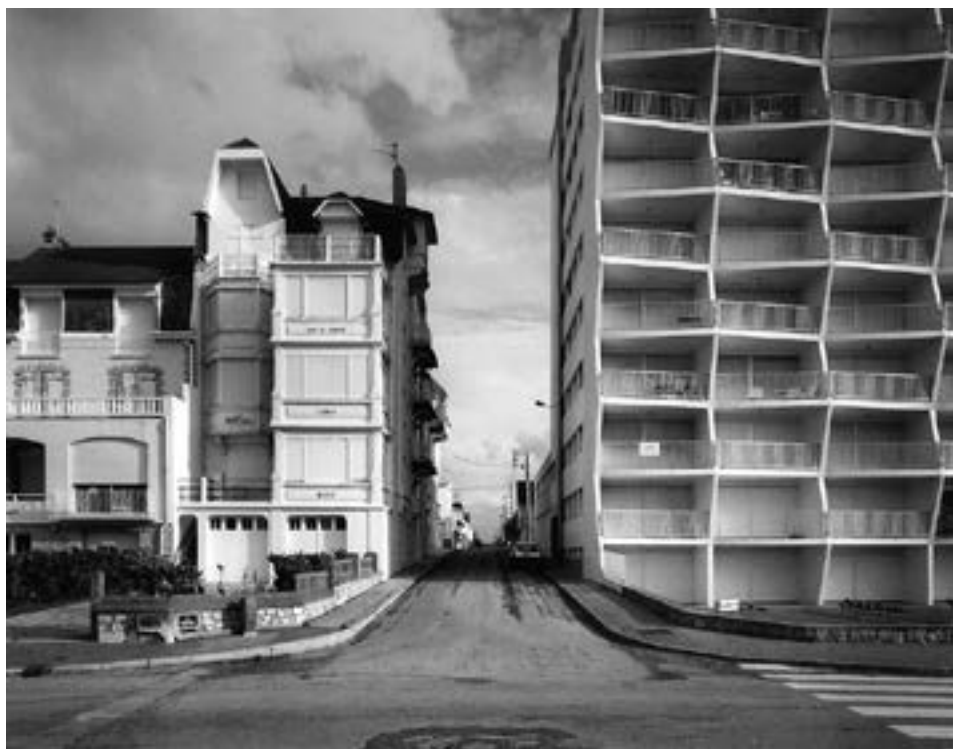
Le Touquet , série des Bords de mer. © Gabriele Basilico, 1984.

Architecte de formation, il travaille comme photographe d'architecture pour l'édition, l'industrie et les institutions publiques et privées. Et en 1983, la PAC de Milan présente sa première exposition importante : Milano, ritratti di fabbrica . En 1984 et 1985, Il participe à la mission photographique de la D.A.T.A.R., initié par le gouvernement français pour documenter la transformation du paysage national contemporain. Il reçoit le premier INU 2000 de l'Institut National de l'Urbanisme pour sa contribution à la documentation sur la ville contemporaine à travers la photographie. Ces derniers travaux photographiques sont dédiés à la transformation urbaine.