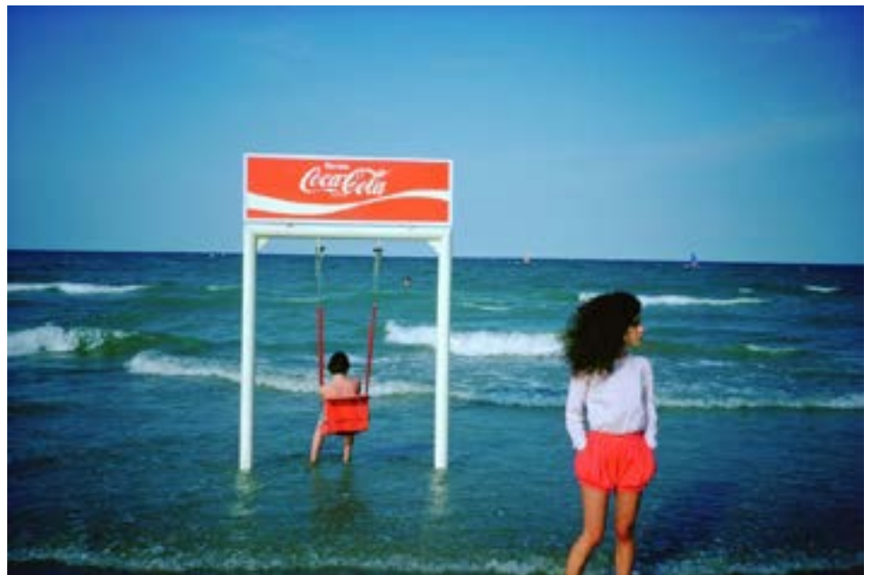
Coca-Cola, Rimini - série L'été italien