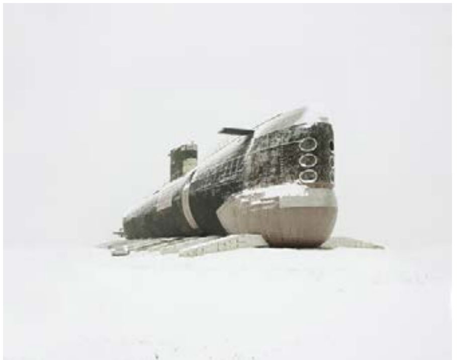
Restricted Areas #12. Région de Samara, Russie. Le plus grand sous-marin au gas-oil du monde.