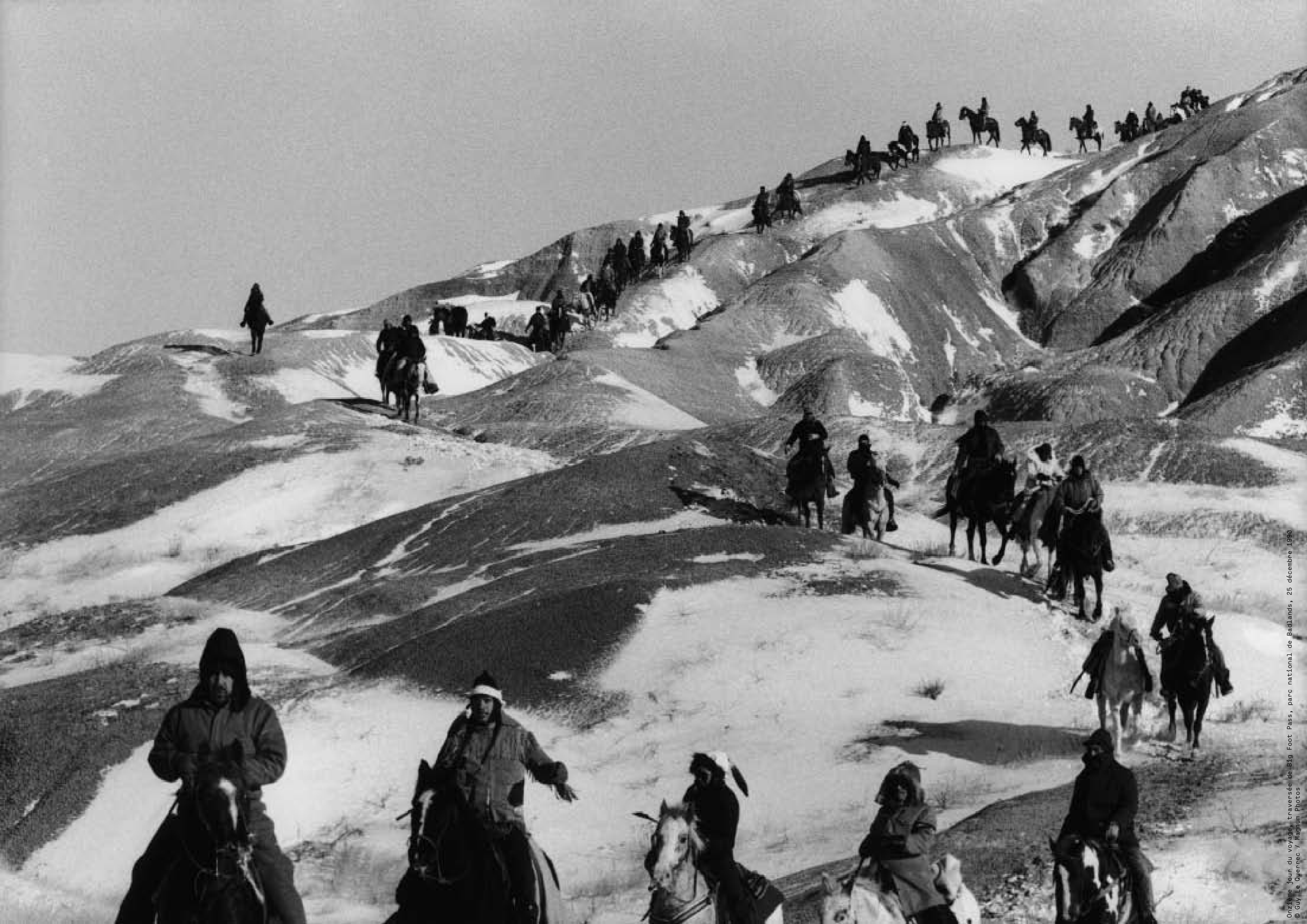
Orzième jour du voyage, traversée de Big Foot Pass, parc national de Badlands, 25 décembre 1990