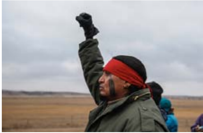
© Stephanie Keith, killing the Black Snake: Standing Rock, 2016

« Quel traité le blanc a-t-il respecté que l'homme rouge ait rompu ? Aucun. Quel traité l'homme blanc a-t-il jamais passé avec nous et respecté ? Aucun. Où sont aujourd'hui les guerriers ? Qui les a massacrés ? Où sont nos terres ? Qui les possède ? Quel homme blanc peut dire que je lui ai jamais volé sa terre ou le moindre sou ? Et pourtant ils disent que je suis un voleur. ... Quelle loi ai-je violée ? Ai-je tort d'aimer ma propre loi ? Est-ce mal pour moi parce que j'ai la peau rouge ? Parce que je suis un Sioux ? Parce que je suis né là où mon père a vécu ? Parce que je suis prêt à mourir pour mon peuple et mon pays ? »