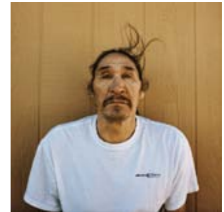
© Marion Gronier, La réserve, 2015

« Quand le dernier arbre sera abattu, la dernière rivière empoisonnée, le dernier poisson capturé, alors seulement vous vous apercevrez que l'argent ne se mange pas. »