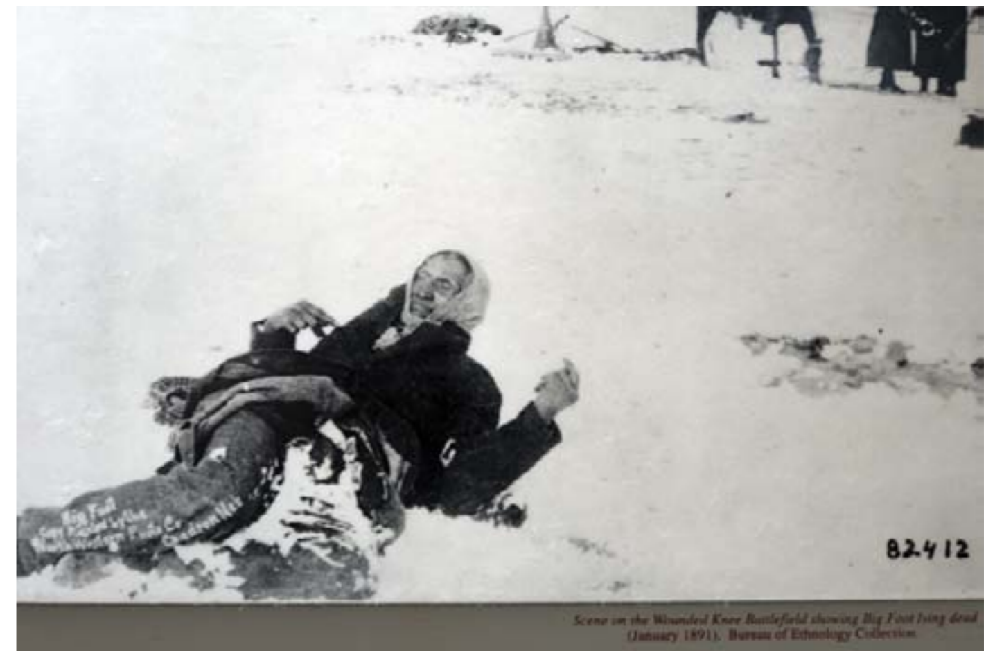
Scene on the Wounded Knee Battlefield showing Big Foot lying dead (January 1891).

Chef Seattle, indien dwamish (déclaration de Port Elliott, 1855).